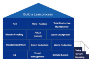
Lean Tools- House Of Lean